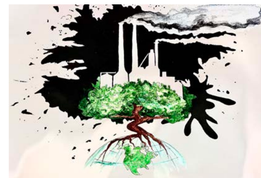
рис. МБОУ «СОШ-ДС №36»