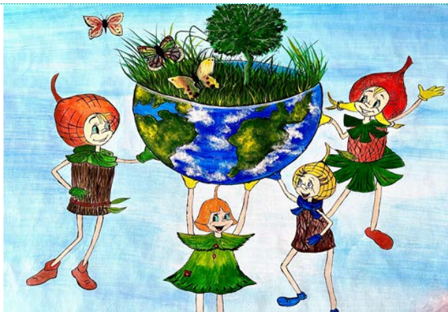
рис. МБДОУ №50 «Малыш»

Природа каждый день одаривает нас своими богатствами. Она дает нам тепло, природные ресурсы или просто позволяет жить на своих бескрайних просторах. Мы должны всегда отвечать природе взаимностью и сохранять чистоту нашей планеты.