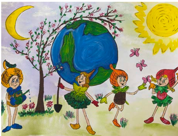
рис. МБОУ «С(К)ОШ «Злагода»

Есть такое понятие окружающая среда, которое каждый понимает по-своему. Вся окружающая нас природа бесценна, потому что все человечество зависит только от нее. Благодаря ей миллиарды лет назад зародилась жизнь. Поэтому сохранение природы в первозданном виде крайне важно, так как состояние природы отражается на нашем здоровье и на здоровье наших детей.