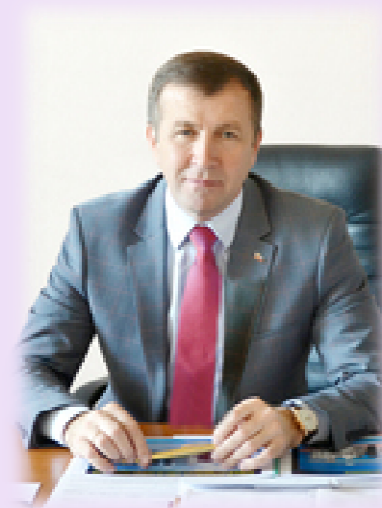
Министерство экологии и природных ресурсов Республики Крым