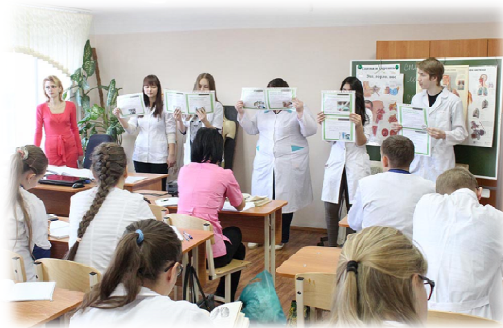
«Агитбригада «Бабушкины рецепты» (профилактика простудных заболеваний)»