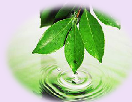
Государственный комитет по водному хозяйству и мелиорации