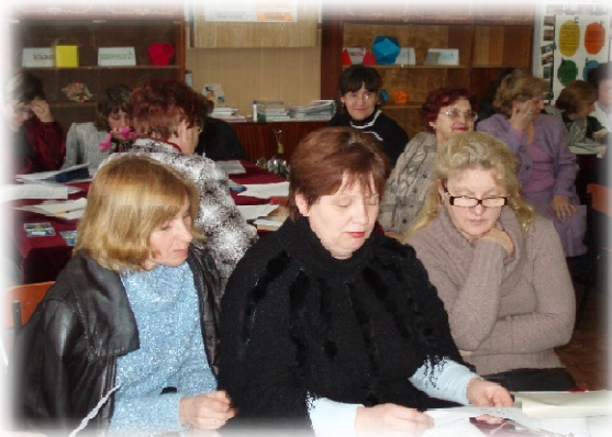
Педсовет «Азбука здоровья»