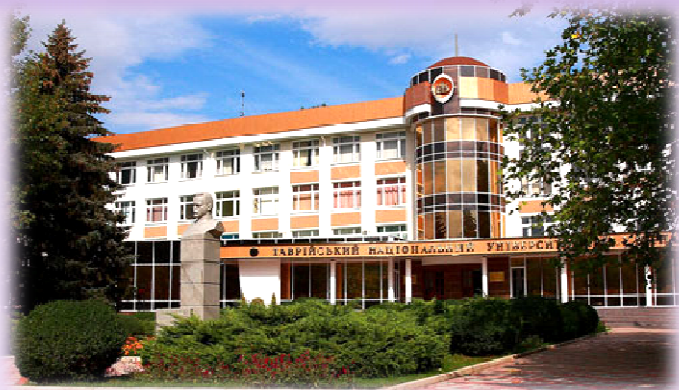
Крымский федеральный университет им. Вернадского