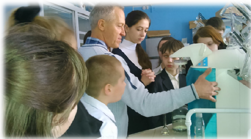
Анализ питьевой воды в школе (лаборатория Министерства экологии и природных ресурсов)