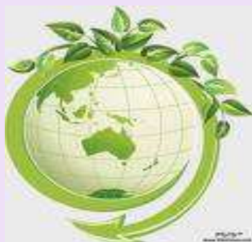
Республиканский эколого-биологический центр