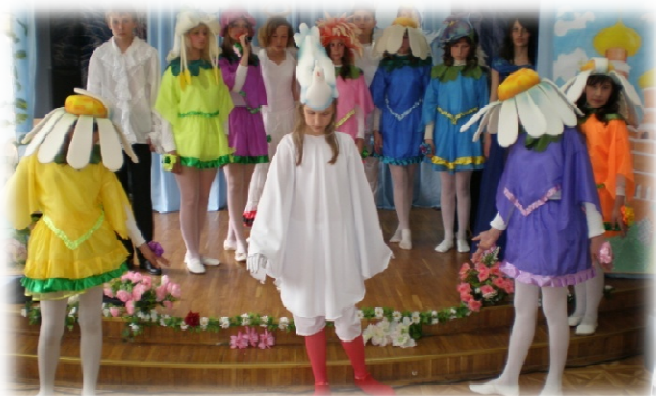
Детский духовный театр «Возрождение» (спектакль о здоровом образе жизни)