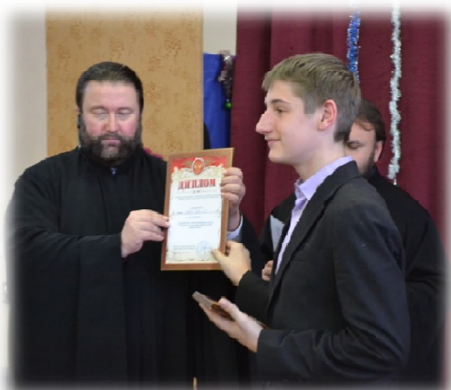
Конкурс знатоков православной культуры «Зерно истины» (II место)