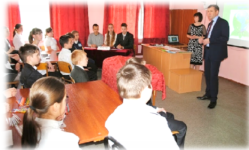
Министр экологии Нараев Г.П. рассказывает учащимся о бережном отношении к природе