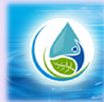
«Крымское управление водного хозяйства и мелиорации»