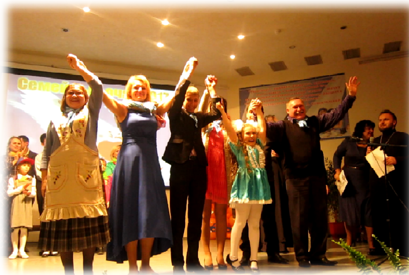
Республиканский конкурс «Семейный очаг» (I место)