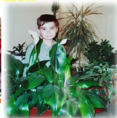
«Галерея комнатных растений»