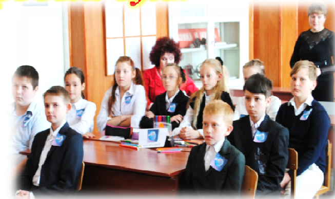
Видеолекторий по здоровому образу жизни