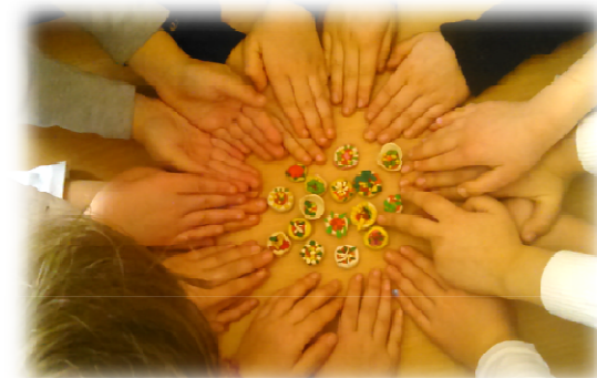
Благотворительная акция «Передай добро по кругу»