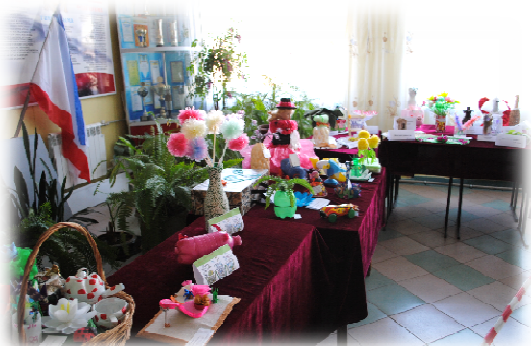
Выставка поделок «Отходы – в доходы»