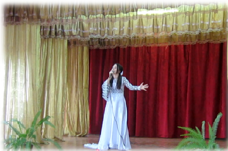
Республиканский конкурс «Дорога к храму» (I место)