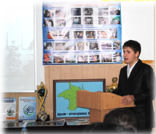
Проектная деятельность: «Иододефицит и его влияние на здоровье подростка»